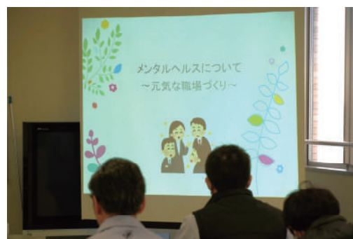
↑ 社内勉強会の様子