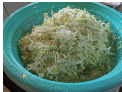
↑スライスキャベツ