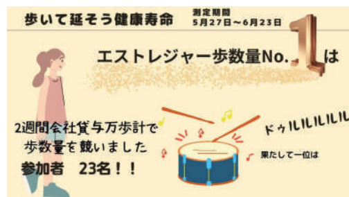
↑ 歩数競争の結果発表