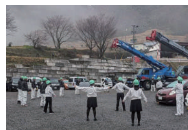
↑ラジオ体操の様子