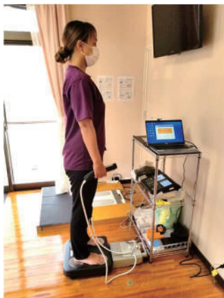
↑体組成測定の様子