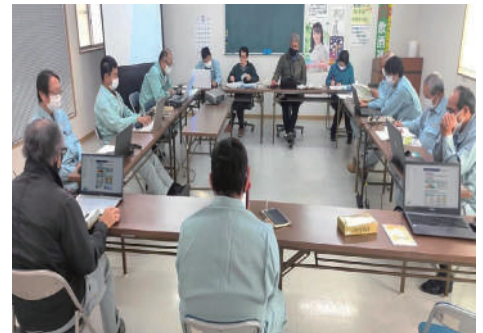
↑全体会議時の健康学習