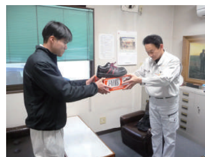
「健康ポイントでの景品交換の様子」→